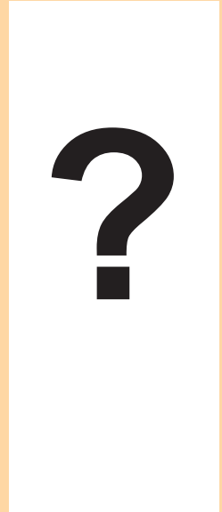
Nach der Behandlung Bald... im 2011